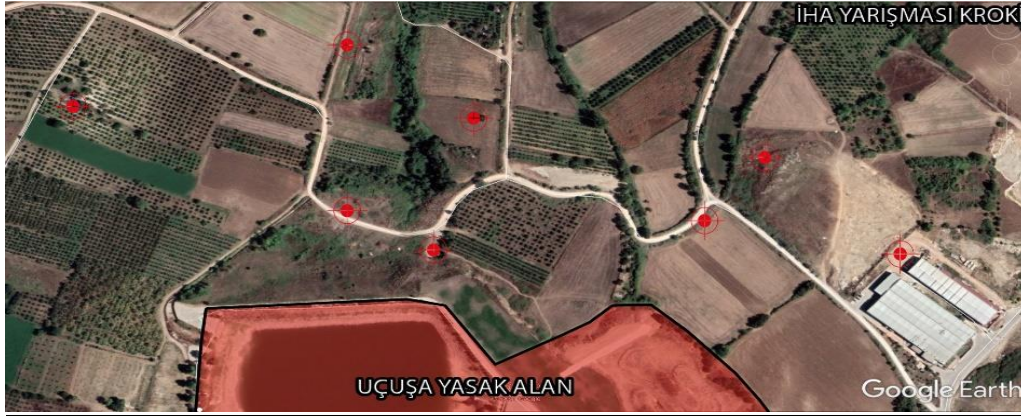
*Sabit Kanatlı Görev Parkuru